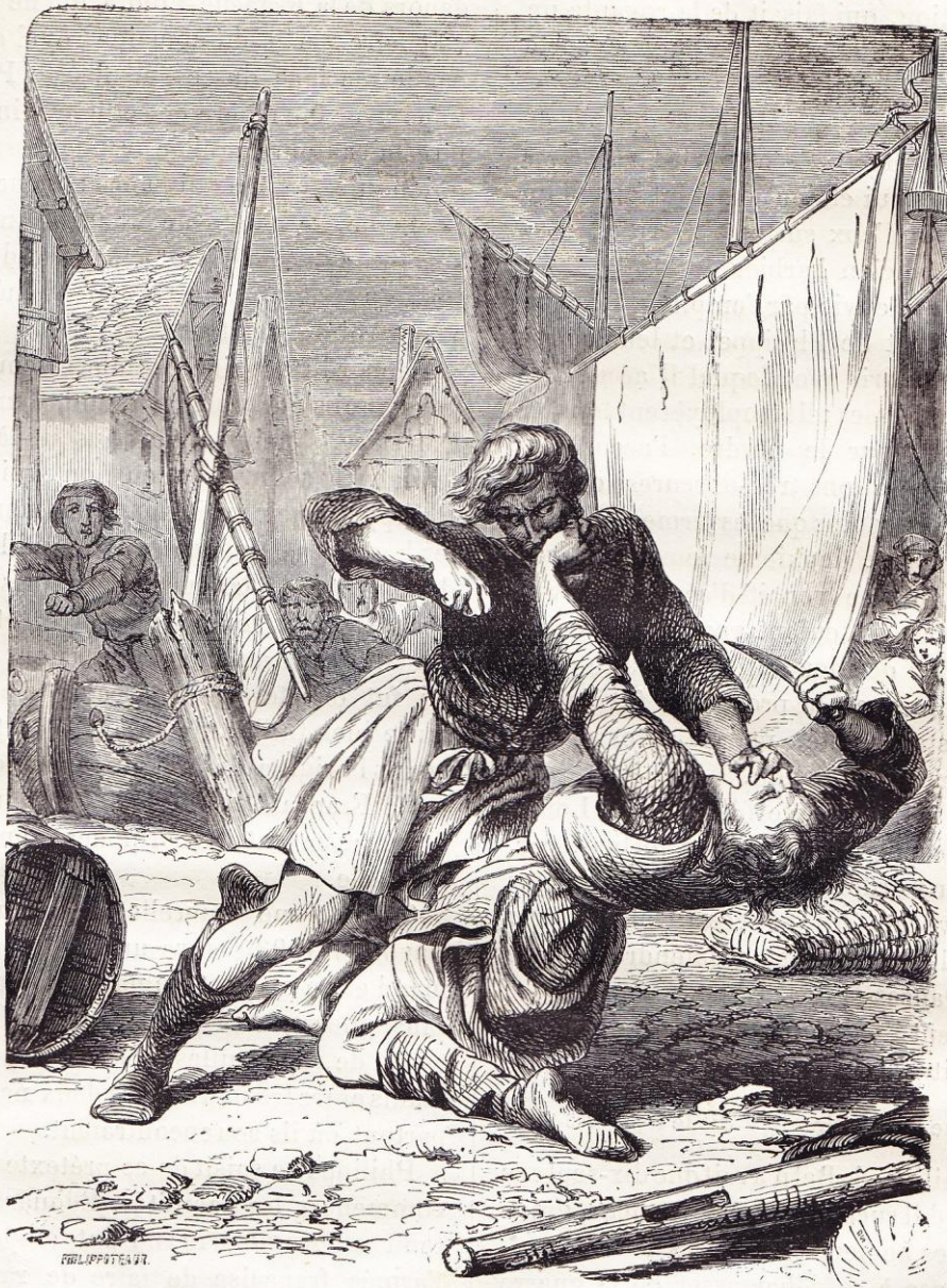
Rixe de matelots à Bayonne (1293); origine de la guerre entre la France et l'Angleterre.